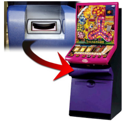
FunSmile G für Barcrest-Geräte

Für Fungames der Firma Barcrest mit Genesis-Gehäuse gibt es das Einbauset FunSmile G . Es beinhaltet eine Blende, damit der Scheinakzeptor in die dafür vorgesehene Öffnung in der Auszahlchale eingebaut werden kann. Die mitgelieferte Metall-Fallkassa wird über ihre Halterung an der unteren Seitenwand eingehängt und verschlossen.