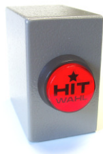
Gastfreundlich: Nicht lange suchen.

Bieten Sie Ihren Gästen mit dem Zubehör „Hitwahl“ Stimmung auf Knopfdruck an. Ein Drücken der Hitwahl-Taste genügt und es werden automatisch Kredite zum Abspielen von Titeln aus den TOP50 oder einer vorher erstellten Hitliste verbraucht. So genießen Ihre Gäste sofort ihre Lieblingsmusik, ohne dass die Titel lange gesucht und angewählt werden müssen.