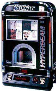
Recycling für ältere NSM-Musikboxen

Mit diesem Kit können die NSM-Musikboxen mit ES-IV und ES-V Technik von störanfälliger und empfindlicher Mechanik befreit werden. U.a. wird der Audio-CD-Wechsler durch einen Mini-PC und der Titelträger für die CD-Cover durch einen LCD-Monitor ersetzt, so dass anschließend normale MP3-Musikdateien abgespielt und dazu ansprechende variable Grafiken auf dem Bildschirm angezeigt werden können.